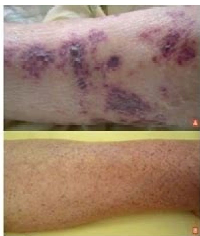
FIGURE 1 Purpura vasculaire (A) et thrombopénique (B).

Le purpura est une lésion cutanée constituée de taches hémorragiques qui sont soit des éléments punctiformes et lenticulaires (purpura pétiécha), soit des lésions de plus grande taille (purpura eozymolique). Les taches hémorragiques sont rouges ou viola-